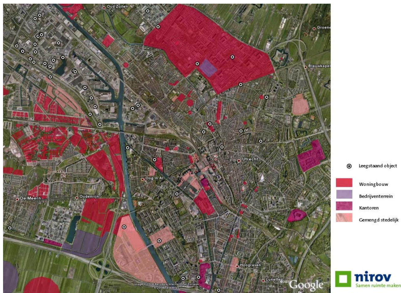
Leegstaande objecten en plannen voor woningbouw, nieuwe kantoren en bedrijventerreinen in Utrecht.